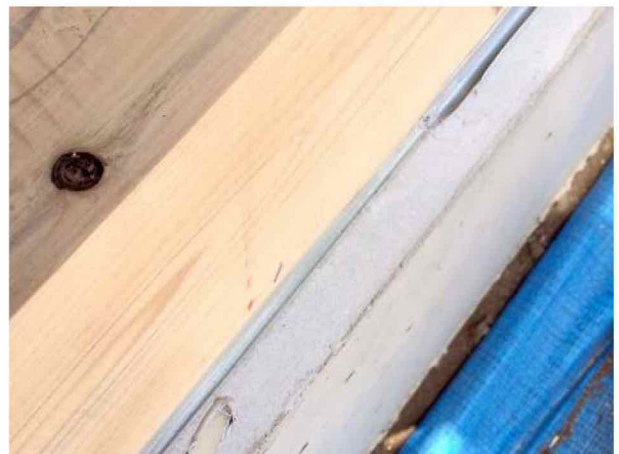
土台と基礎間の気密処理