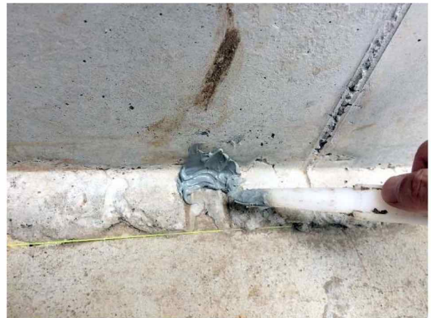
セパレート金具音障防蟻処理