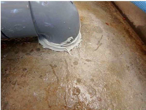
配管音障防蟻処理