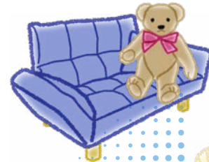
家財道具の防虫 除菌など。