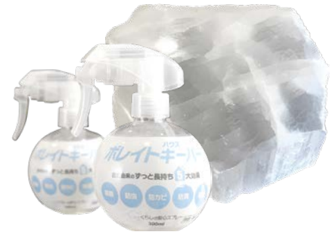
原料に自然素材を採用。ホウ酸塩鉱物。

※2 完全な防災・耐火の機能を提供するものではありません。火の元には十分ご注意ください。