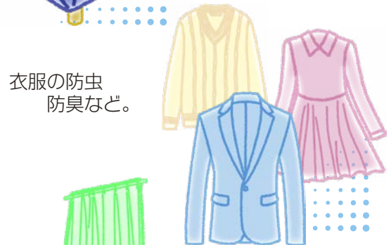
衣服の防虫 防臭など。