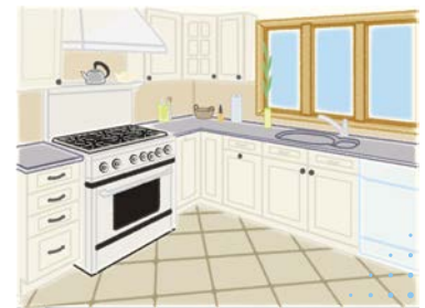
キッチン周りの除菌・防臭・防カビに。

カバンの中に一つ、オフィス・車の中・勉強部屋などの各お部屋、イベント等の景品、ちょっとしたプレゼント、お試用に。小さいボトルに「ホウ酸のチカラ」がたくさん詰まっています。通常のサイズとは携行用などでお使い分けいただけます。ますます身近にボレイトハウスキーパー TM 、是非お試しください。