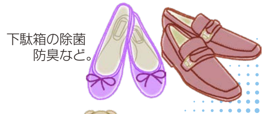
下駄箱の除菌 防臭など。