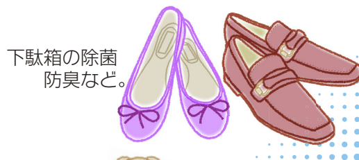
下駄箱の除菌 防臭など。