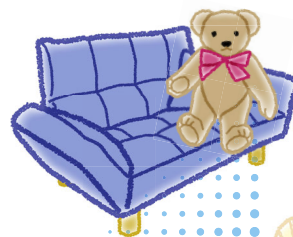
家財道具の防虫 除菌など。