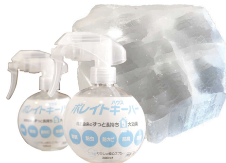
原料に自然素材を採用。ホウ酸塩鉱物。

※1 カビがすでに発生している場合は除カビ剤などで除去・乾燥のあとにご使用ください。 ※2 完全な防災・耐火の機能を提供するものではありません。火の元には十分ご注意ください。