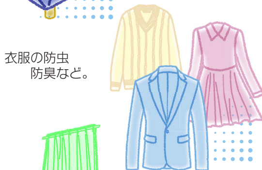
衣服の防虫 防臭など。