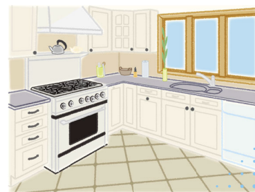
キッチン周りの除菌・防臭・防カビに。