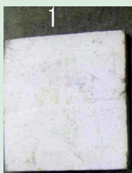
カビ抵抗性試験-木片表面(実期間3年相当経過)