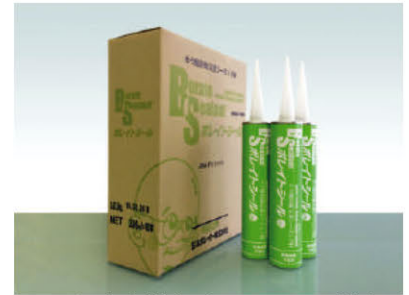
ホウ酸防蟻気密シーリング材 ボレイトシール