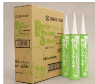
ホウ酸防蟻気密シーリング材 ボレイトシール

※基礎外断熱工法の場合は、新築時にボロンdeガード®新築シロアリ保証を付保し、その付保条件に合致した状態が継続していること。