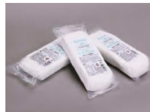
ホウ酸防蟻気密パテ ボレイトファイラー