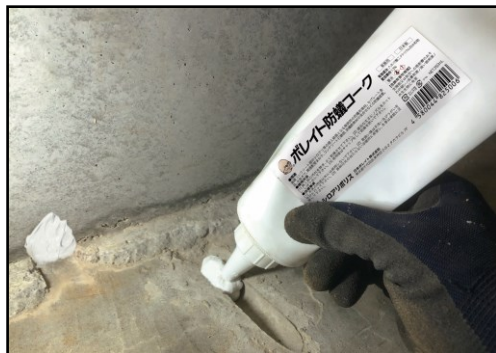
既存住宅床下での施工例