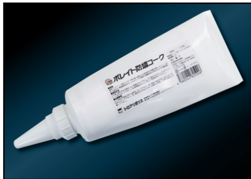
ボレイト防蟻コーク™

従来の防蟻充填材は、防蟻成分に有機系合成殺虫剤を採用しており、効果は数年でした。「ボレイト防蟻コーク™」は、防蟻成分に無機系の八ホウ酸二ナトリウム四水和物を採用することにより、長期間にわたり優れた防蟻効果を発揮します。