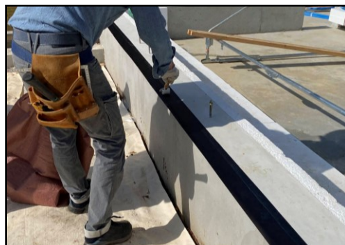
基礎外断熱材の天端への施工例